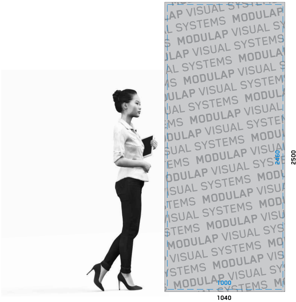
BEISPIEL: MOTIV ÜBERGREIFEND ÜBER 2 ODER MEHR MODULE EXAMPLE: OVERLAPPING MOTIFS COVERING 2 OR MORE MODULES